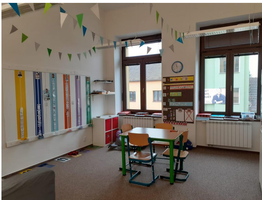
c) Prostor pro nestructurovaný volný čas žáků