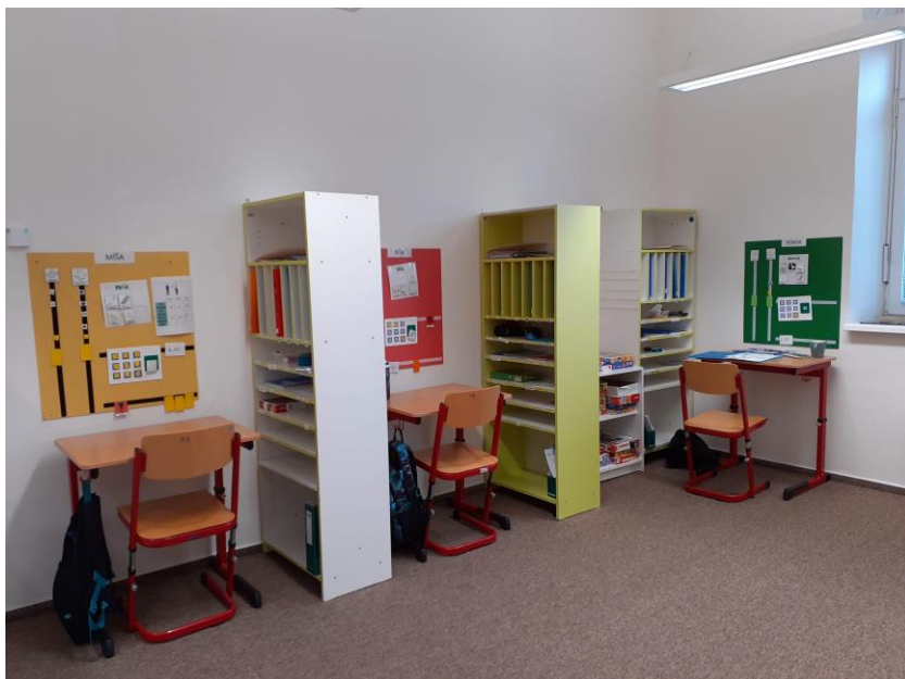
a) Strukturovaná pracovní místa žáků

Fotografie ilustrující uspořádání tříd na ulici Štolcova: