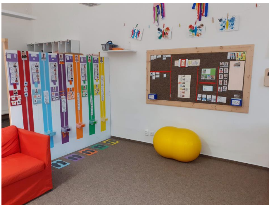
d) Prostor pro nestructurovaný volný čas žáků