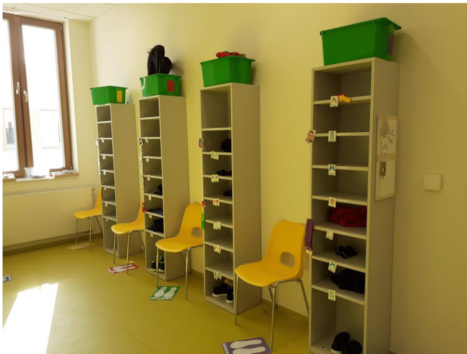
e) Prostor šatny