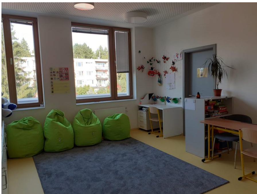
c) Prostor pro trávení nestrukturovaného volného času žáků