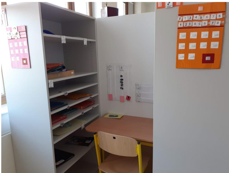
f) Strukturované pracovní místo