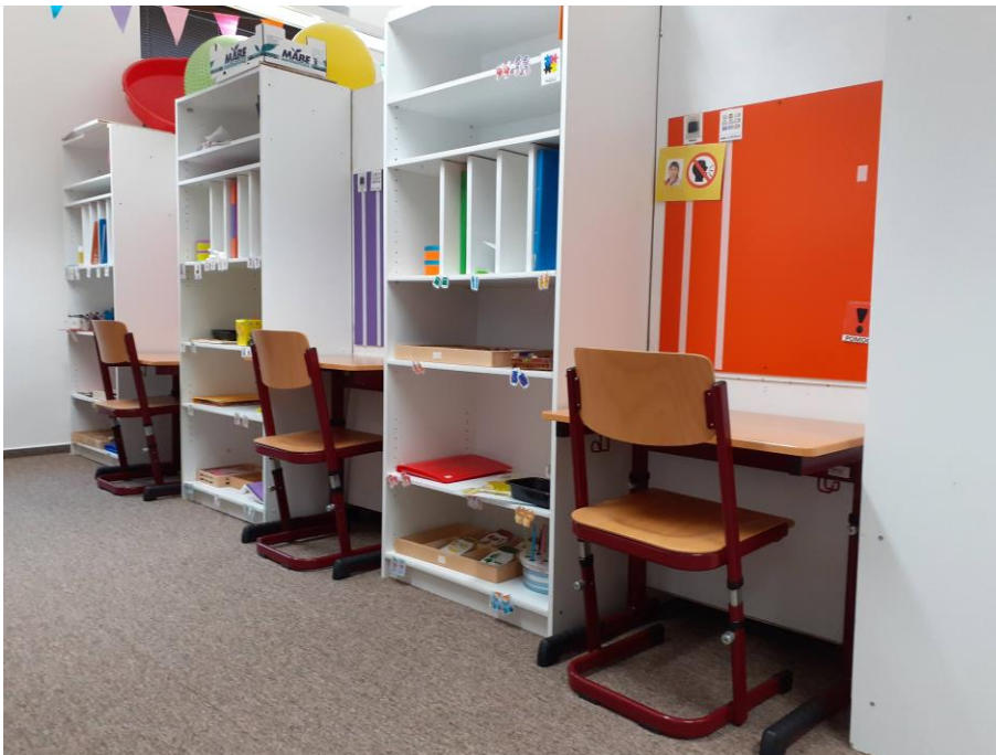
b) Strukturovaná pracovní místa žáků