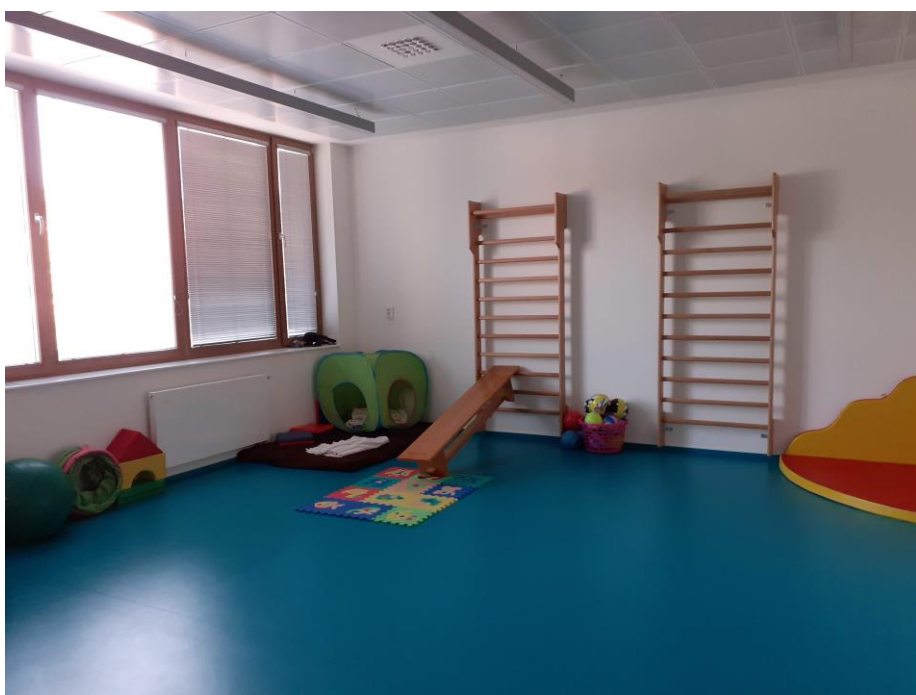
h) Malá tělocvična