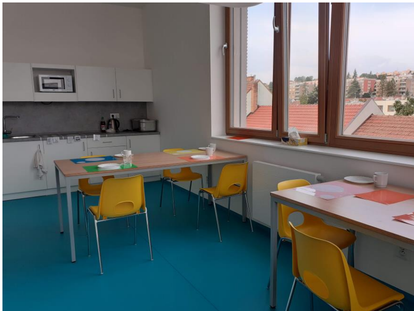
a) Jídelna vlastní pro jednu třídu