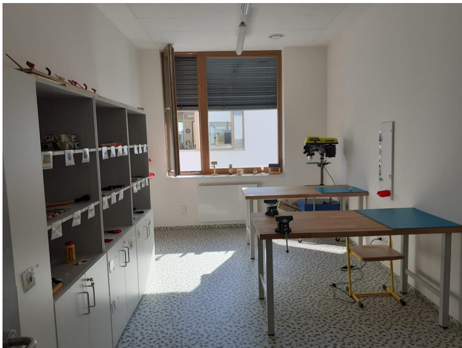
g) Technická dílna