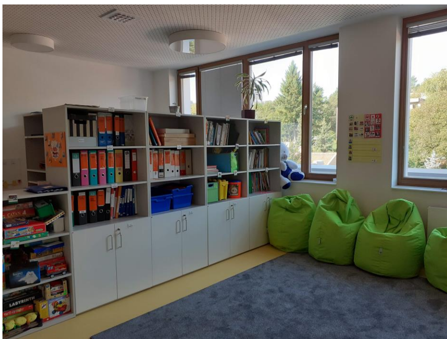
d) Prostor pro trávení nestrukturovaného volného času žáků